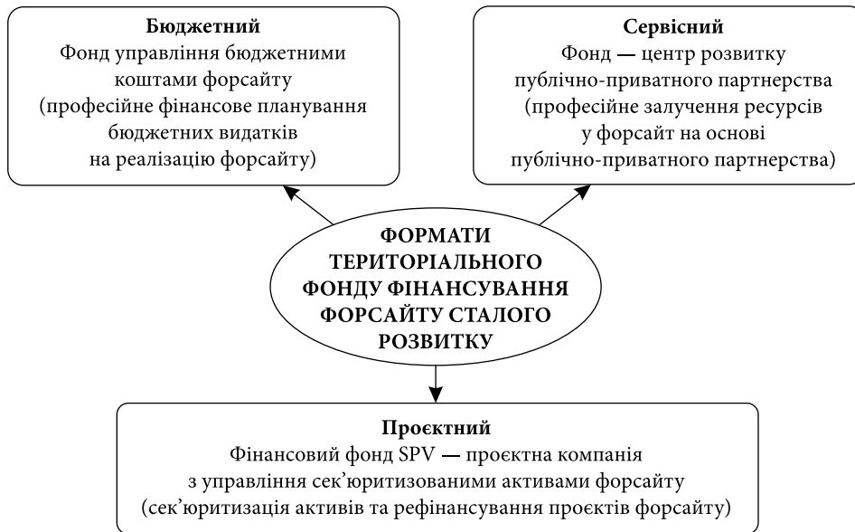
Рис. 2. Базові формати територіального фонду фінансування сталого розвитку за форсайт-підходом

бутніх поколінь, як це пропонується на даному етапі створення цієї фінансової установи в нашій країні. Також слід зазначити, що на перспективу варто розглянути на державному рівні питання про використання як джерела рентних надходжень для наповнення цих фондів не тільки мінерально-сировинних, але й земельних, водних і лісових ресурсів, проте, очевидно, що дане питання вимагає окремого дослідження.